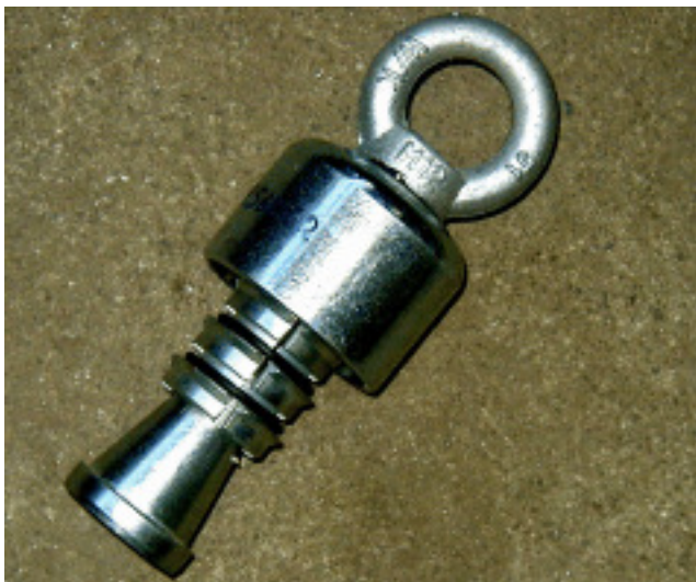
Innenziehköpfe für PEHD-Rohre -mit Abdichtung- Pulling head for PEHD-Tube -with seal-