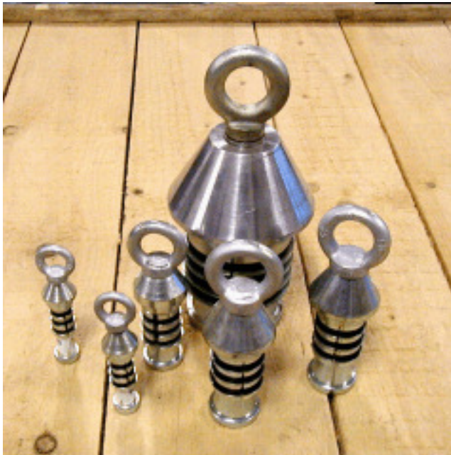
Innenziehköpfe für PEHD-Rohre -ohne Abdichtung- Pulling head for PEHD-Tube -without seal-