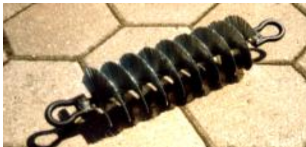
Kanalbürste mit Stahldrahtborsten und Linksdrall Duct brush with steel bristles and left spiralled