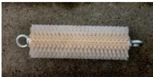
Kanalbürste mit Kunststoffborsten Duct brush with plastic bristles