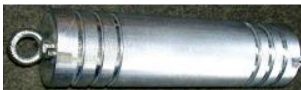
Röhrenfeile Pipe file